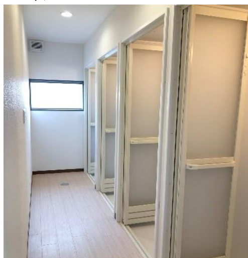
《シャワースペース》